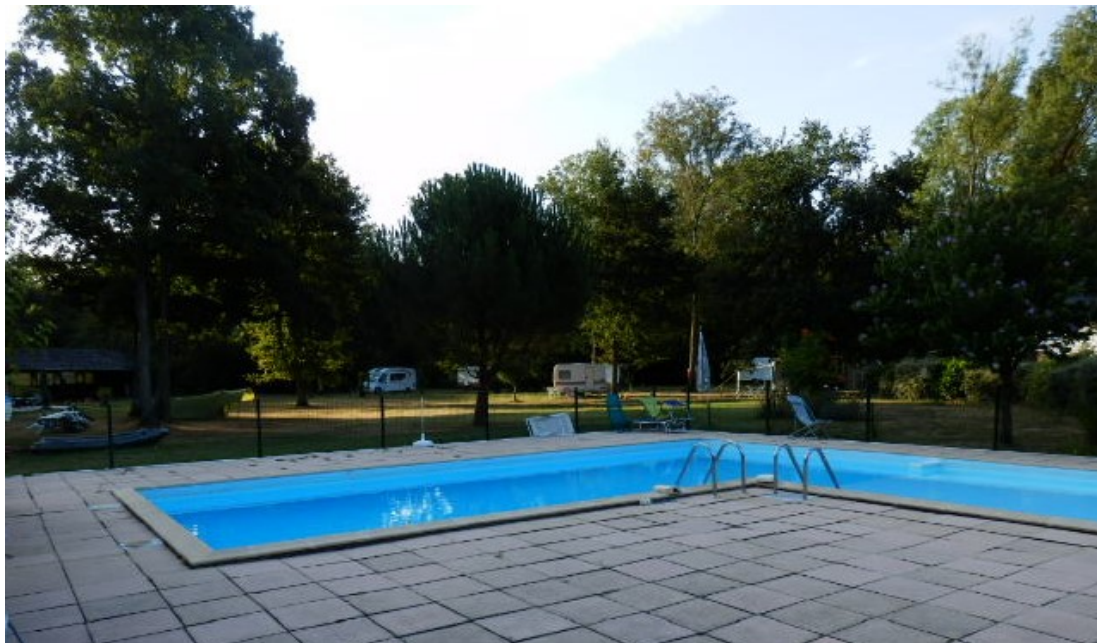
La piscine au lever du soleil

Nous y avons passé une semaine agréable, le seul regret étant de devoir prendre la voiture pour aller au ravitaillement, et la baguette absente au petit déjeuner ! Nous y reviendrons.