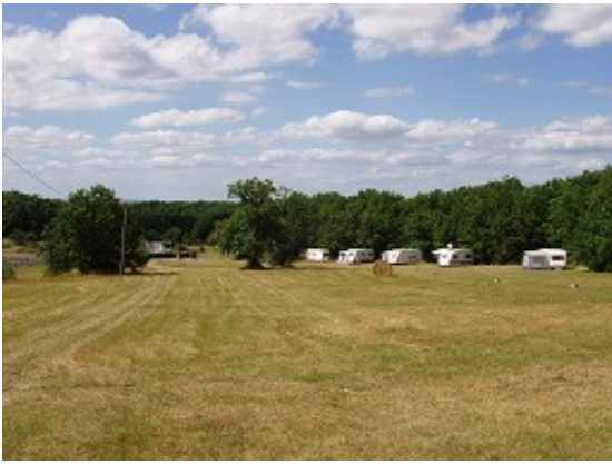
Champ côté Est, bien ensoleillé