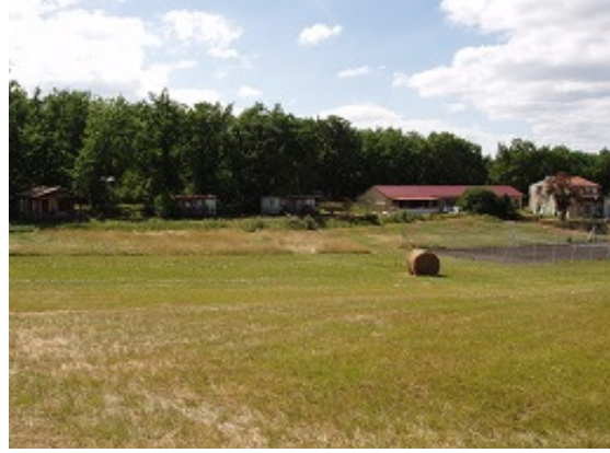
Maison d'habitation et bungalows