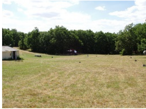
Clairière du haut, sanitaire No3