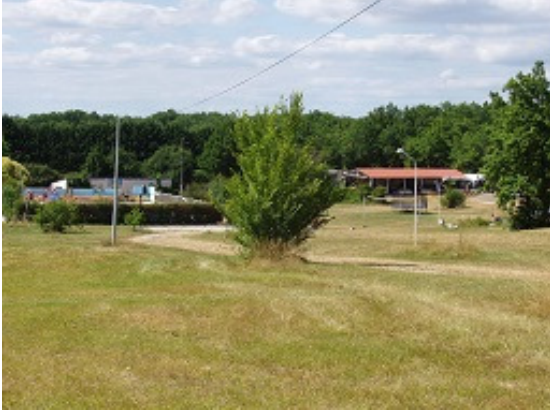
La piscine, le bâtiment d'entrée