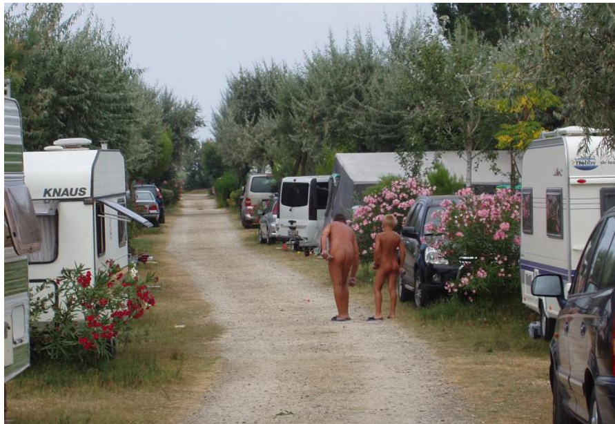
Une allée typique du camping