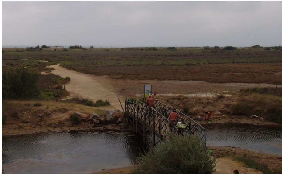
Accès à la mer

Il semblerait que la municipalité actuelle souhaite que la plage reste naturiste entre St Pierre et les Cabanes de Fleury, elle a fait cette année un grand effort pour la nettoyer et l'entretenir. De ce fait la Grande Cosse, seul camping donnant sur cette plage, devrait rester naturiste au moins jusqu'à la fin de la législature actuelle, dans 4 ans. Au vu du faible taux d'occupation (camping et locations), Cap Fun pourrait être tenté de renoncer au naturisme, mais comme les autres campings textiles font aussi face à une baisse de fréquentation ce ne serait que perdre une fidèle clientèle naturiste.