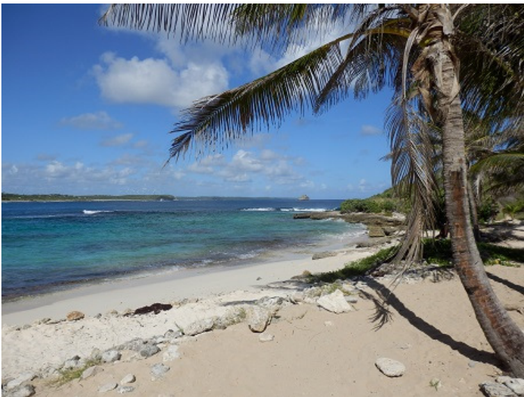
plage naturiste Anse Tarare