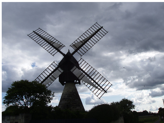
Le moulin de la Herpinière

Une bonne adresse pour faire étape en Val de Loire ou pour se reposer au calme. Nous y sommes revenus cette année pour la troisième fois, rien ne semble avoir changé en trente ans, mais le domaine a son charme et les tarifs sont modestes.