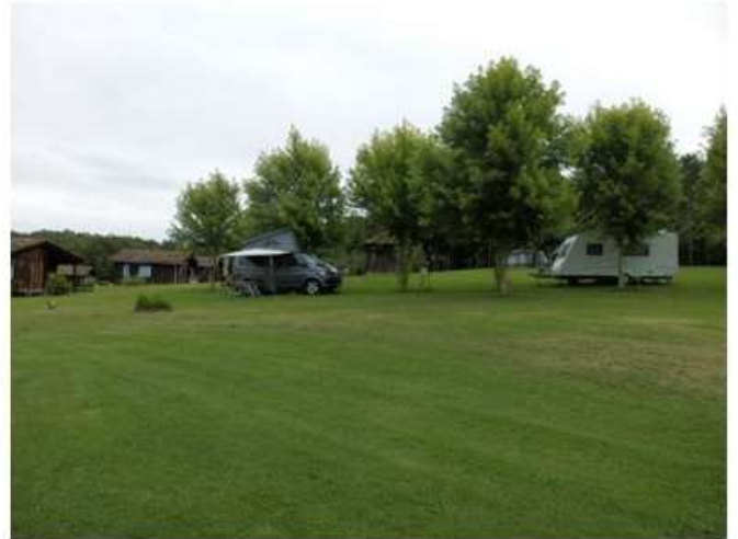
Chalets en location et emplacements de camping sur le haut du domaine