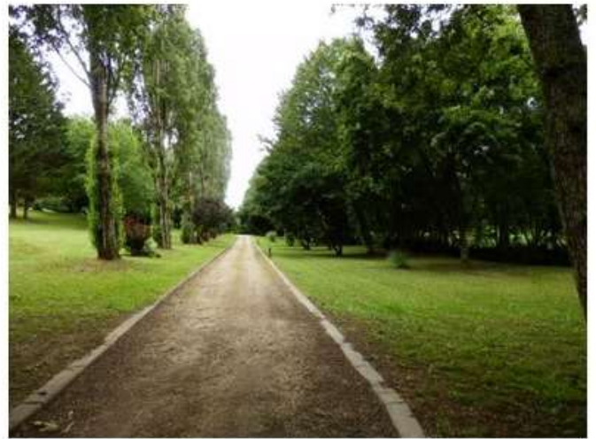
Le petit étang et allée du camping sur le bas du domaine