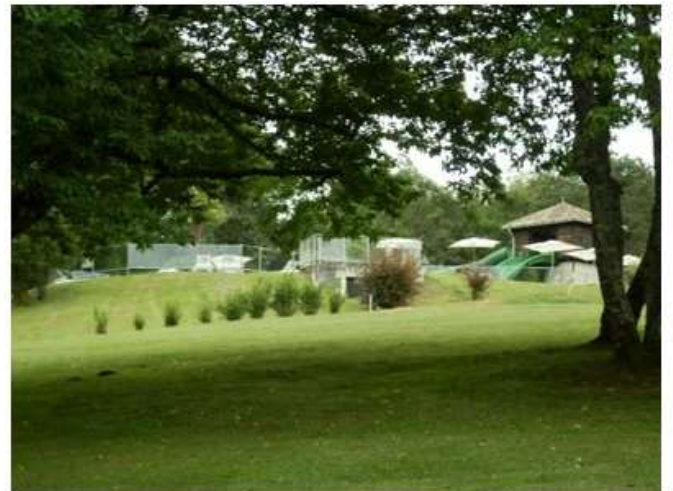
Bloc sanitaire et espace piscine vu depuis le bas du domaine