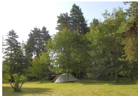
De la place pour camper