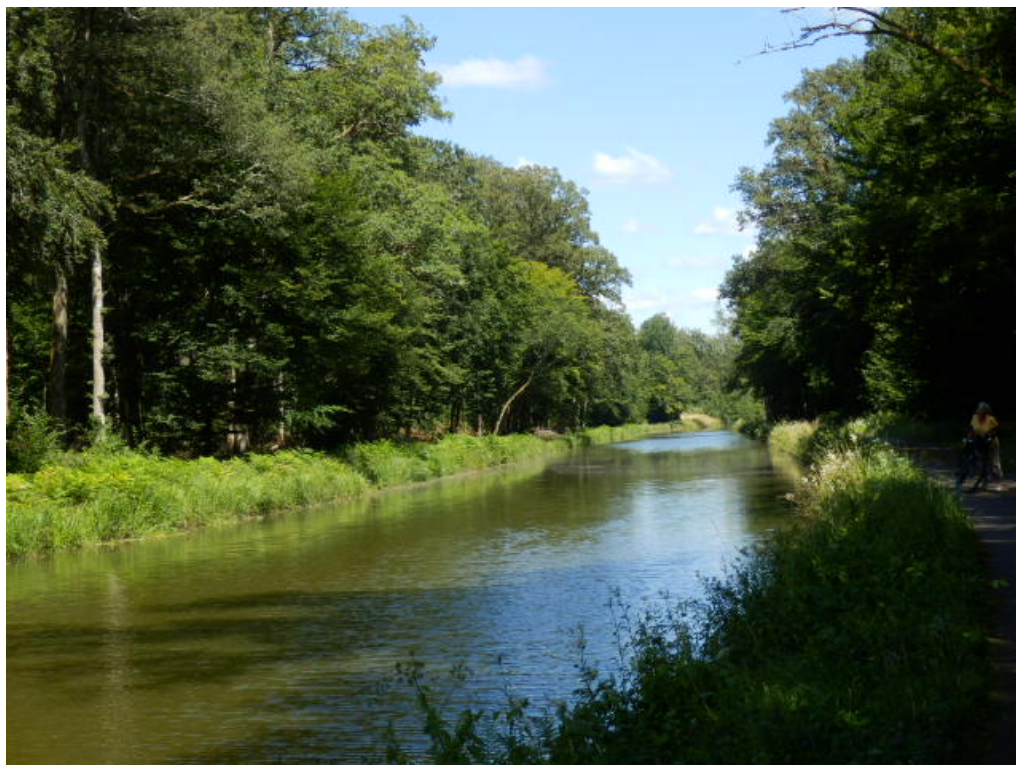
La Voie Bleue longeant le canal de l'Est