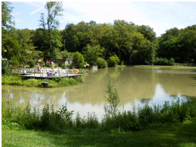
L'étang principal, l'île et au fond la réception