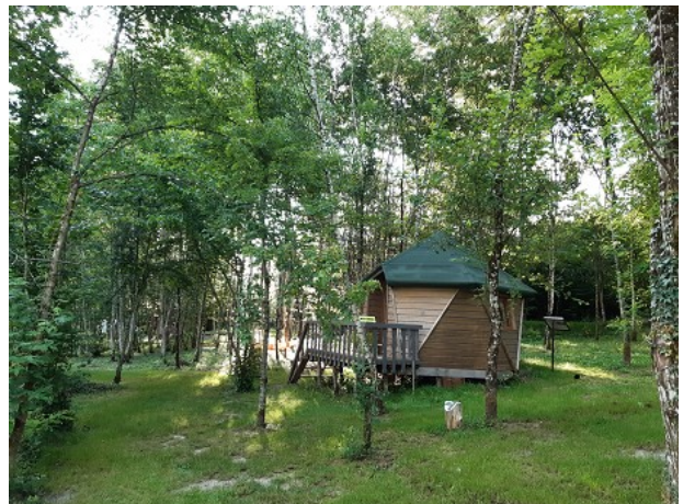
Une des cabanes en location