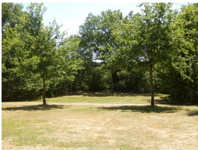
Un « petit » emplacement

Beaucoup d'espace, très joli domaine, naturisme très bien respecté, belle piscine, accueil sympathique, nous avons apprécié notre séjour aux Fourneaux avec comme seul bémol le fait de ne côtoyer presque aucun campeur francophone.