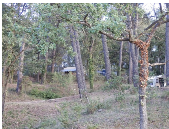
Quelques emplacements du camping