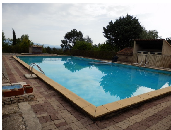
La piscine, vue sur le Luberon