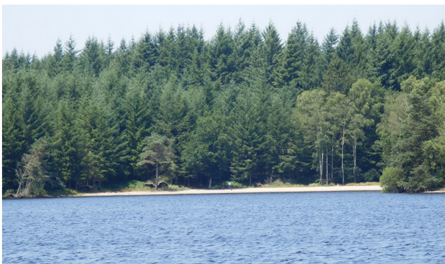
Une partie de l'aire naturiste vue du large

L'aire naturiste officielle est une grande plage de sable, en partie ombragée, qui descend en pente douce dans le lac. L'endroit est assez sauvage. Fréquentation en majorité par des hommes, quelques couples, mais comportement correct la journée et nudité bien respectée.