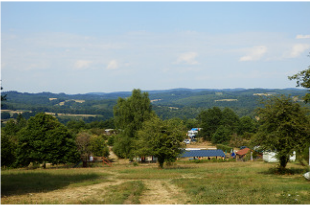
Vue du haut du camping