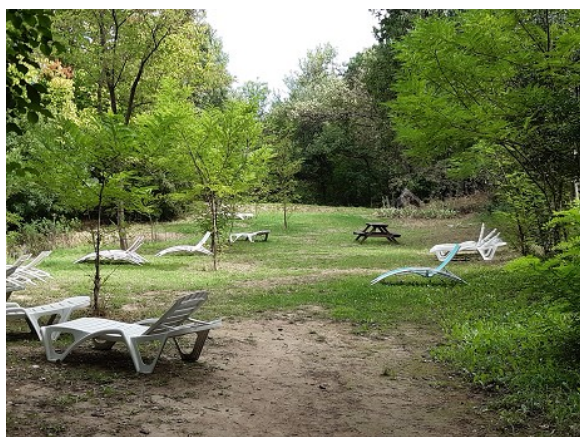
Terrasse en bord de rivière