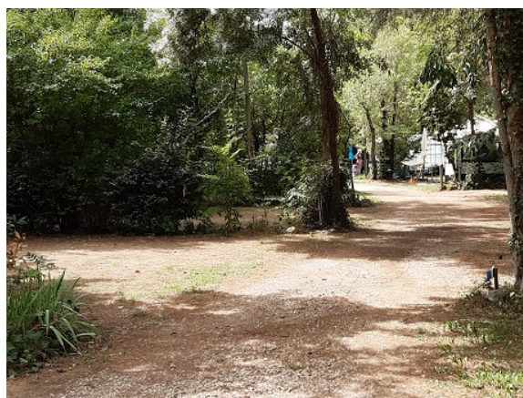
Une allée du camping