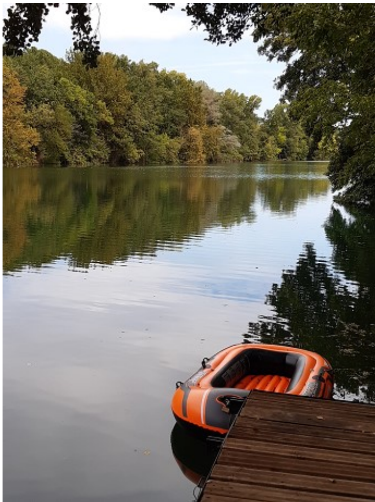
Baignade dans l'Hérault