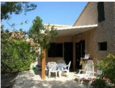
Un bastidon des Hauts de Bélézy

Nous avons séjourné en 1999 dans un bastidon des « Hauts de Bélézy » mais n'avons pas eu la possibilité de visiter ce hameau naturiste lors de notre séjour 2014 en camping.