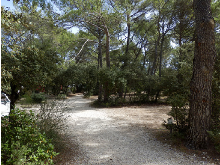
Sous-bois du camping