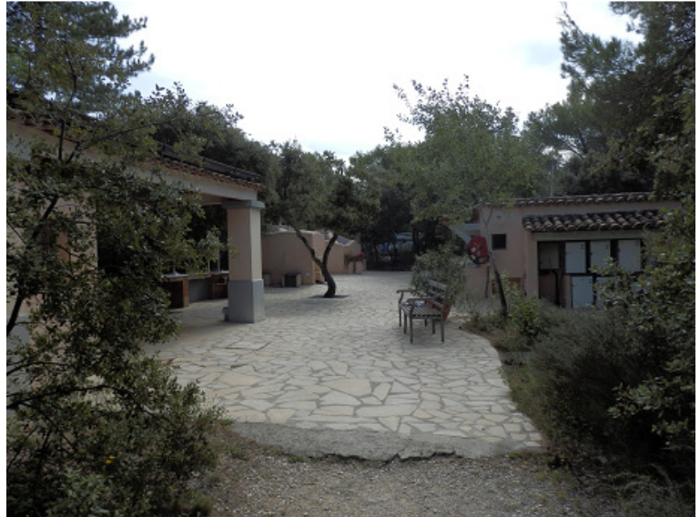
Le sanitaire « cerisiers »

Nous avons séjourné en 1999 dans un bastidon des « Hauts de Bélézy » mais n'avons pas eu la possibilité de visiter ce hameau naturiste lors de notre séjour 2014 en camping.