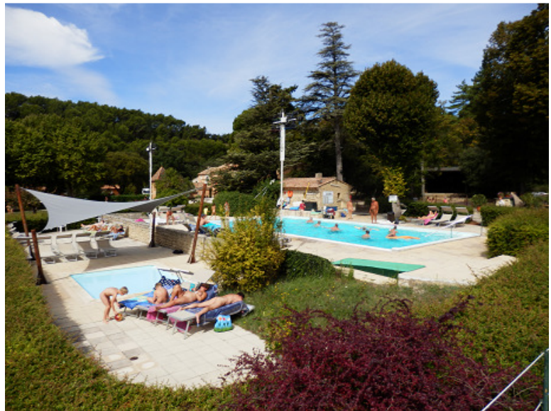
Les deux autres piscines