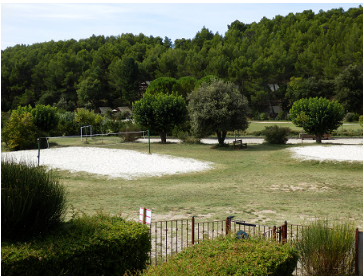
Terrains de sport