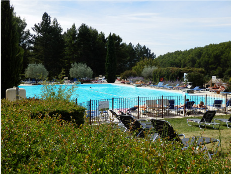
La grande piscine