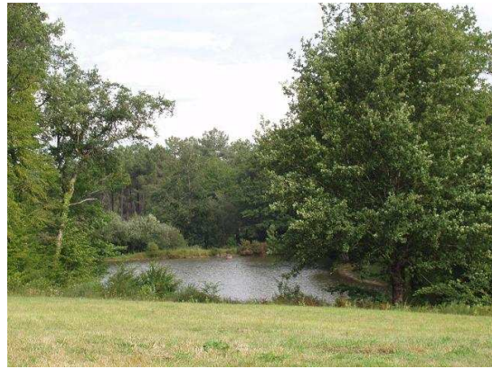
Etang de pêche