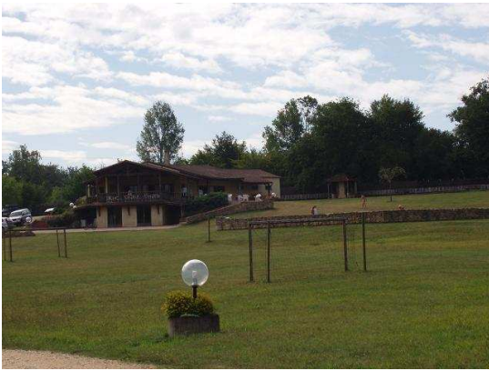
Réception – bar – piscine