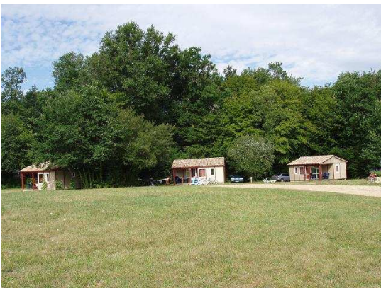
Bungalows en location