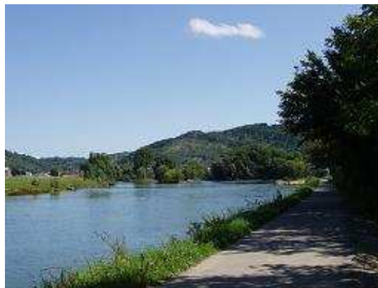
La VR6 longeant le Doubs près d'Osselle

Nous avons été très bien reçus par les responsables du club et nous repasserons volontiers. Il est évident qu'aucune animation n'est proposée et sur semaine vous pourrez vous sentir un peu seuls, mais cela a aussi son charme.