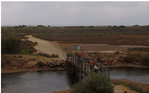
Accès à la mer

Système WiFiPass disponible mais très onéreux (cartes prépayées à la durée).