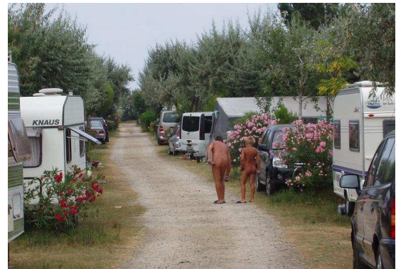
Une allée du camping