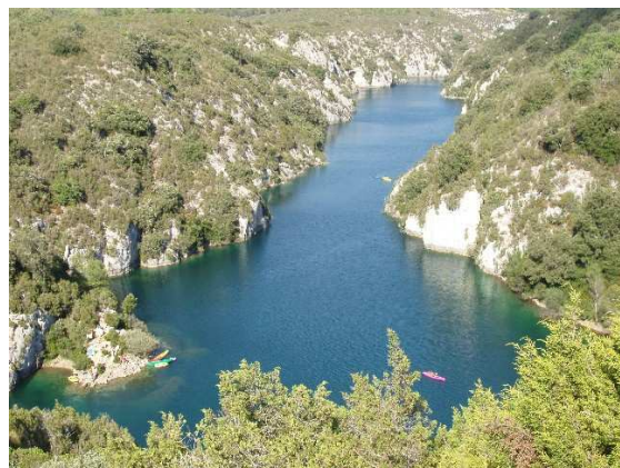
Baignade au lac (accès en bas à gauche)