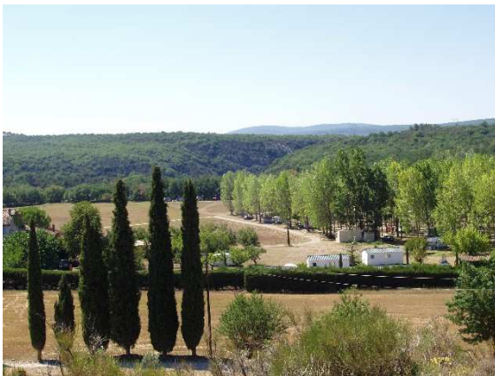
Vue depuis l'entrée du domaine

Un vrai domaine naturiste comme on les aime et où l'espace ne manque pas. Cadre naturel splendide pour la baignade dans le Verdon, dommage que l'eau du lac soit si froide. Tarifs assez élevés comparés à d'autres domaines semblables. Nous reviendrons sans hésitation.