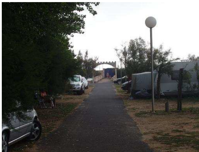
Accès direct à la plage naturiste par le portail bleu au bout du camping

Une bonne adresse pour le campeur naturiste qui souhaite séjourner en bord de mer, camping très bien tenu, nous y reviendrons sans hésitation.