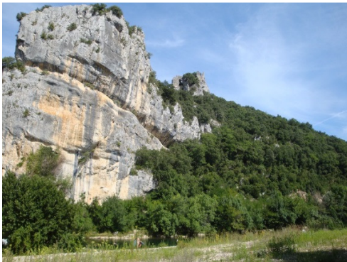
Accès à la Cèze en amont

Le tri des déchets est organisé et le domaine comprend trois points de collecte. La fréquentation est assez équilibrée entre francophones et étrangers non francophones. La nudité est en général bien respectée, mais on regrettera cependant l'obligation de porter en permanence un bracelet d'identification.