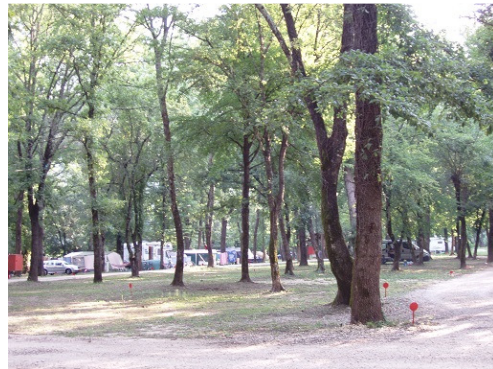
La zone dite « sauvage »

La zone naturiste de la Cèze s'étend sur plus de 2 kilomètres, commençant par un méandre en amont de la Sablière et se terminant en aval du Ran du Chabrier. La descente de la rivière est facile, que ce soit en kayak (en prêt à la réception), matelas, bouées, ou tout autre pneumatique. Elle n'est généralement pas pratiquée par des « textiles » venus d'ailleurs.