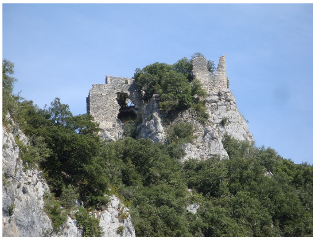
Les ruines du Château de Fereyrolles surplombent la zone naturiste

Les bords de la Cèze conservent leur aspect très nature et la baignade y est fort agréable. Chacun trouvera le camping naturiste de son choix (voir page suivante). Nous avons apprécié La Genèse, mais La Sablière ou Le Château de Fereyrolles ont aussi leurs avantages.