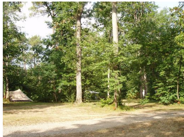
Le camping et ses larges emplacements