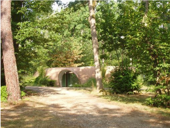
Le bloc sanitaire original et fonctionnel

Le camping est en retrait un peu plus haut dans la forêt de chênes et de pins (domaine de 10 hectares). Les 45 emplacements sont vastes et marient judicieusement ombre et soleil. Six locations sont disponibles. Au centre le bloc sanitaire est original et très fonctionnel, félicitations à son concepteur. Petit bémol à relever, l'absence de papier aux toilettes. Les camping-cars ne semblent pas être les bienvenus et sont parkés sur 2 petits emplacements à l'entrée.