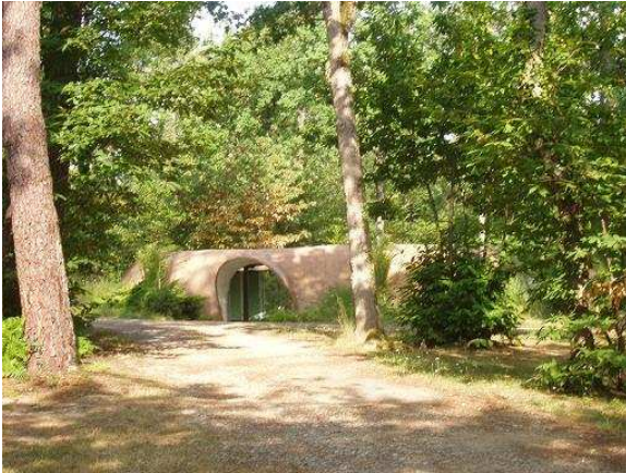
Le bloc sanitaire original et fonctionnel

Le camping est en retrait un peu plus haut dans la forêt de chênes et de pins (domaine de 10 hectares). Les 45 emplacements sont vastes et marient judicieusement ombre et soleil. Six locations sont disponibles. Au centre le bloc sanitaire est original et très fonctionnel, félicitations à son concepteur. Petit bémol à relever, l'absence de papier aux toilettes. Les camping-cars ne semblent pas être les bienvenus et sont parkés sur 2 petits emplacements à l'entrée.