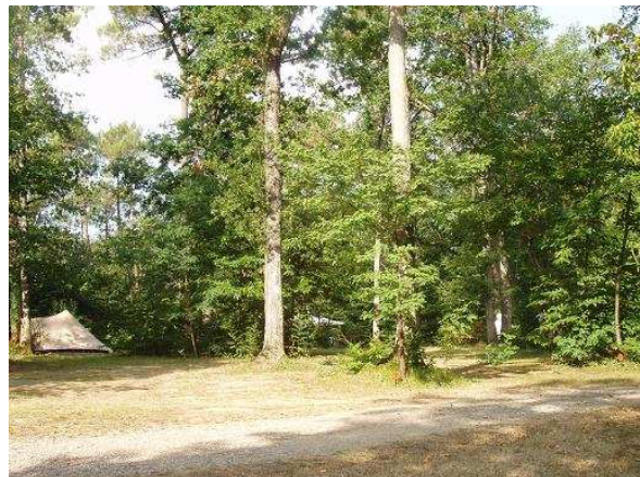
Le camping et ses larges emplacements