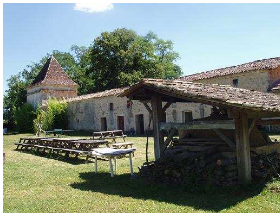
Le four à pain et les sanitaires du camping