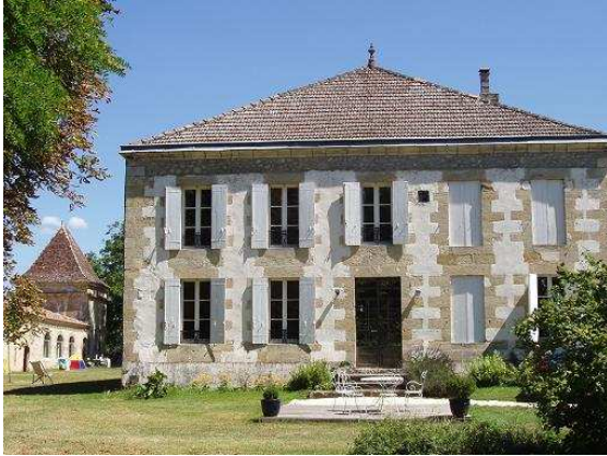
Le château (la piscine est de l'autre côté)

La piscine relativement grande (12x12m) est au centre des bâtiments et 26 emplacements de camping répartis dans le parc boisé du domaine ainsi qu'un petit bloc sanitaire annexe. Les voitures sont autorisées sur les emplacements ce qui n'est pas du tout gênant.