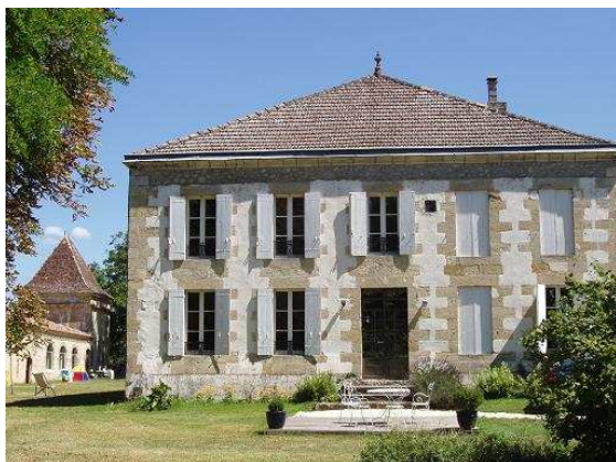
Le château (la piscine est de l'autre côté)

La piscine relativement grande (12x12m) est au centre des bâtiments et 26 emplacements de camping répartis dans le parc boisé du domaine ainsi qu'un petit bloc sanitaire annexe. Les voitures sont autorisées sur les emplacements ce qui n'est pas du tout gênant.