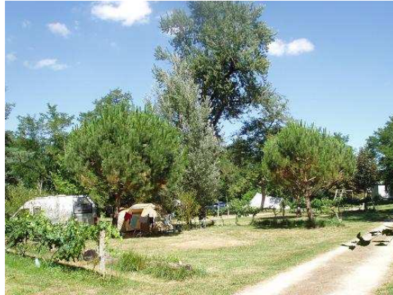
Le parc du château où se trouvent les emplacements de camping