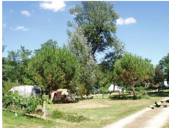
Le parc du château où se trouvent les emplacements de camping