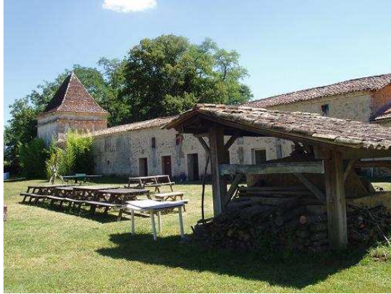
Le four à pain et les sanitaires du camping