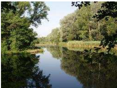
L'étang pour la baignade

Une bonne adresse pour faire étape, visiter Vienne et faire du vélo. Accueil sympathique des responsables et des membres du club. Mais si vous ne campez pas, inutile de venir sur ce terrain, les rives du « Neue Donau » vous permettront de passer gratuitement une excellente journée naturiste aux portes de Vienne.