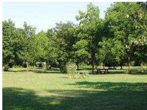
La prairie pour visiteurs journaliers