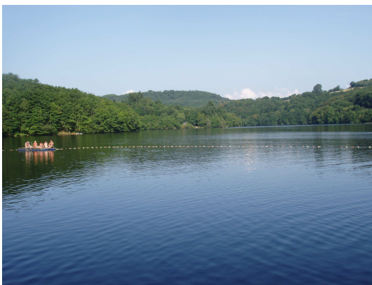
L'espace baignade vu de la plage

Nous avons apprécié ce domaine naturiste pour son cadre, son calme, sa baignade et la région, mais nous avons évidemment regretté l'absence de francophones avec qui pouvoir discuter.