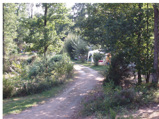
Une allée du camping