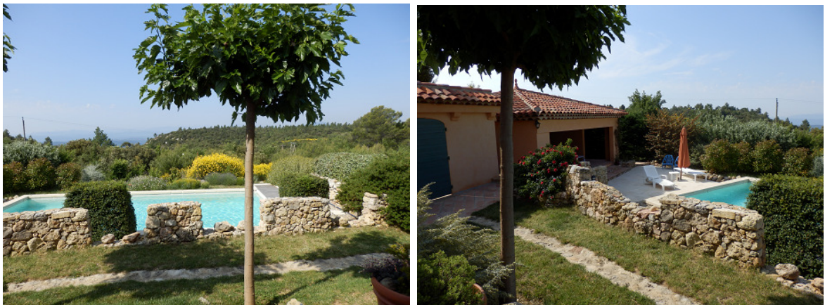
La piscine vue depuis notre chambre

De belles chambres d'hôtes naturistes à recommander sans hésiter pour tout couple naturiste. Une région à découvrir à pieds ou en voiture, mais relativement éloignée de la Méditerranée.