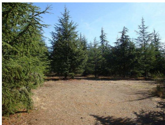
Un emplacement libre !