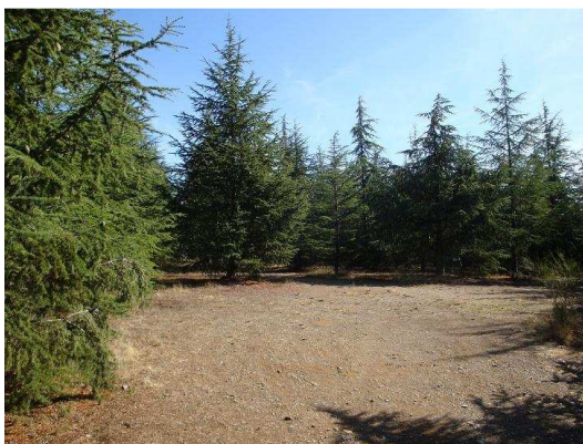
Un emplacement libre !